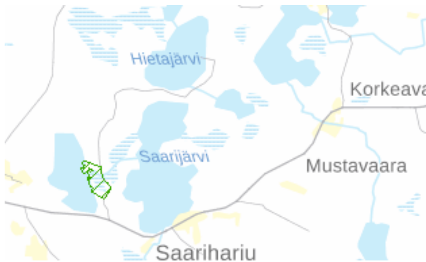
Kuva 3. Ranta-asemakaava-alueen sijoittuminen.

Ranta-asemakaavan sijainti ilmenee oheisesta kartasta.